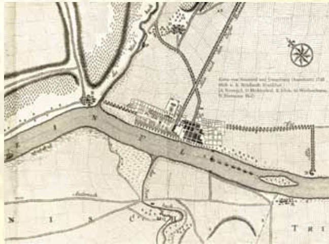
Karte von Neuwied und Umgebung. Kupferstich von A. Reinhardt 1745

rechtlich nur auf die reichsrechtlich anerkannten drei großen Konfessionen bezog, genossen faktisch natürlich auch die Mennoniten Religionsfreiheit. Bis 1680 waren sie zwar noch verpflichtet, den reformierten Gottesdienst zu besuchen, dann aber wurden sie in einer Duldungsurkunde von dieser Auflage entbunden. Die Juden schließlich waren wie die Mennoniten schon in den 1650er-Jahren Einwohner Neuwieds gewesen, hatten aber nie als Religionsgruppe, sondern nur als Einzelpersonen die Erlaubnis zur Ansiedlung erhalten. Ihre Aufnahme