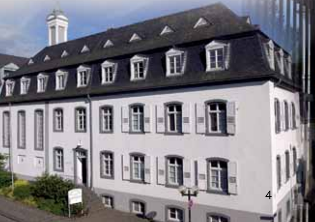
Städtische Galerie Mennonitenkirche

ferner ist Sechstens abgeredt/Und bestatht von Wein / und Bier zuveratzen / auch in würdt/ zur halberweck Unk/ und zu andere thut/ und gelassen werden